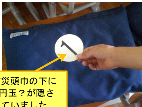
防災頭巾の下に1円玉が隠されていました。