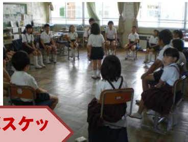
マルチバスケット

教室で、なんでもバスケットや宝さがし・シルエットクイズ・伝言ゲームなどでみんなが楽しめました。